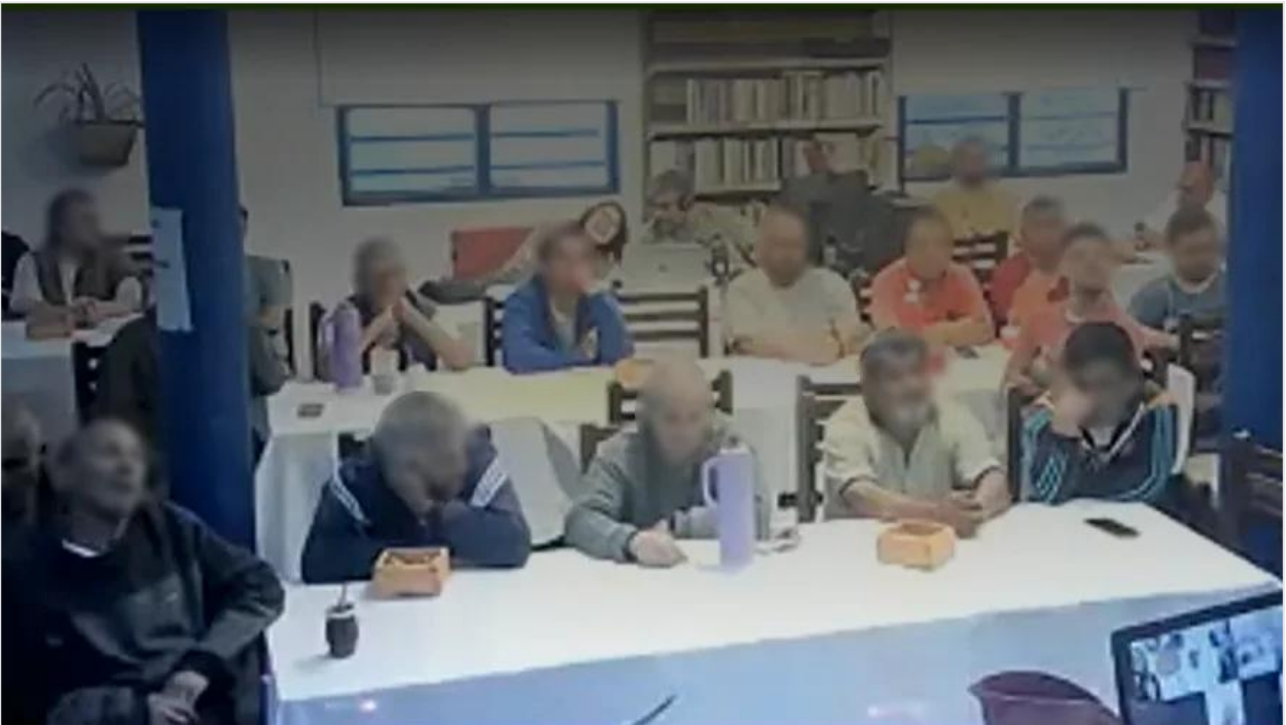
La classe, suivie depuis le salon du Punto de Paz, à Batán.